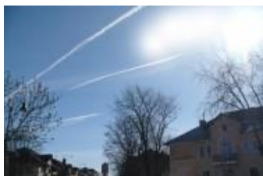
Joonis 1. Triibud taevas