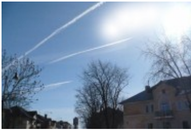
Joonis 1. Triibud taevas